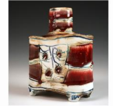
Thomas Leganyi www.leganyiceramics.com hochwertige Gebrauchskeramik und Einzelstücke aus Porzellan