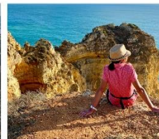
Andrea Reck Freie Journalistin www.redaktionsbuero-andrea-reck.de Fotoshow Europas wilder Westen: Wandern auf dem South West Coast Path/England und dem Fisherman's Trail/Portugal Eintritt frei Samstag, 7. Juni, 20 Uhr