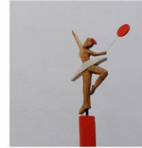
Wolff Zint Holzskulpturen www.zintdesign.de Holz, ausschließlich mit der Kettsäge bearbeitet - und doch überraschend fein