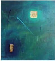
Ingrid Fritzsche nur am zweiten Wochenende da (8.6. bis 9.6.) Acrylmalerei Erlebnisse und Eindrücke werden kreativ in Farben vereint