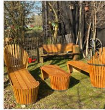
Johannes Reck Möbel www.duene-7.de neue Gartenbänke von rustikal bis elegant auch in Sondermaßen nach Ihren Wünschen herstellbar