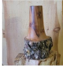
Detmar Roloff Drechselarbeiten totes Holz wird wiederbelebt zum Sehen und Fühlen